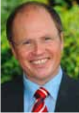
Burkhard Albers Landrat des Rheingau-Taunus-Kreises